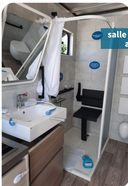
salle de bain adaptée